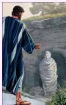
La risurrezione di Lazzaro.